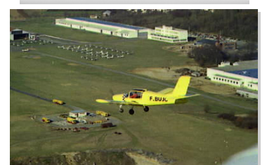
Rallye marin au dessus de la Socata

A noter dans vos AGENDAS : la prochaine réunion de l'Association est programmée le : Mardi 9 Février à 17 H30