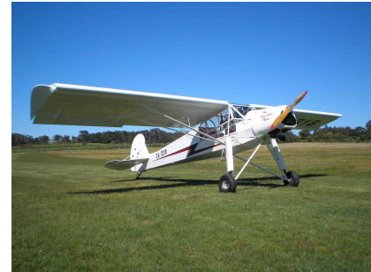
Réplique du MS Storch Photo transmise par un client australien