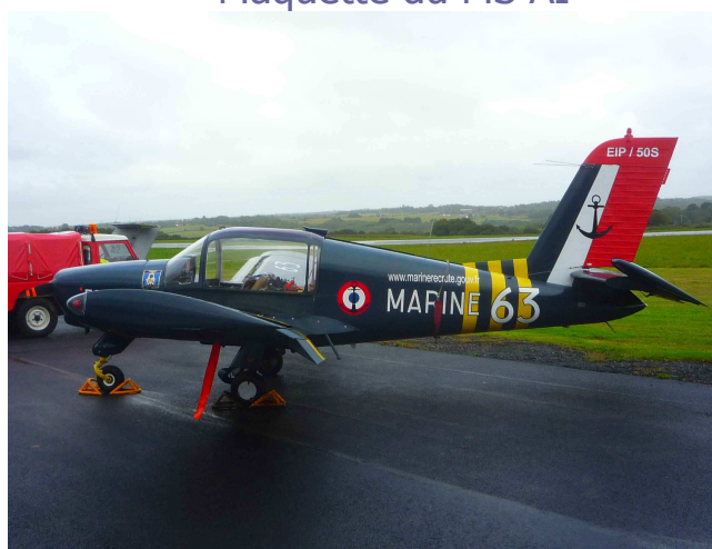
Rallye de la Marine

Association des Amis du Patrimoine historique Morane-Saulnier et Socata DAHER-SOCATA - Direction du Support Clients Aéroport Tarbes-Lourdes-Pyrénées 65921 Tarbes Cedex 9 asso.ms@s@socata.daher.com