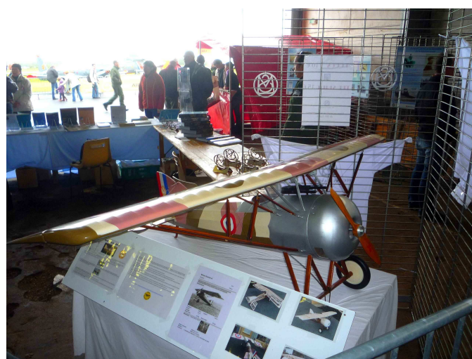
Maquette du MS AI