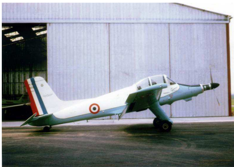
MS 1500 Epervier 01, équipé d'un Astazou XIV devant la CGTM à Pau en juin 1961

Le Directeur de travaux et son collègue qui travaille avec nous, se rendent le 4 octobre à Morlaix pour finaliser également les partenariats entre l'Association MS, Armor Passion, le lycée Jean Dupuy et le lycée Tristan Corbière de Morlaix. L'objectif est de transmettre des avions à Jean Dupuy, sur lesquels ils travailleront et qu'ils remettront en état avant de nous les restituer. A terme ces avions constitueront les avions du Musée Morane-Saulnier.